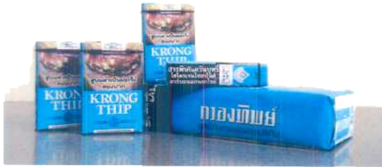
บุหรี่ปรรกรองทิพย์ รูปแบบใหม่ (ตรากรองทิพย์ ไลท์ เดิม)